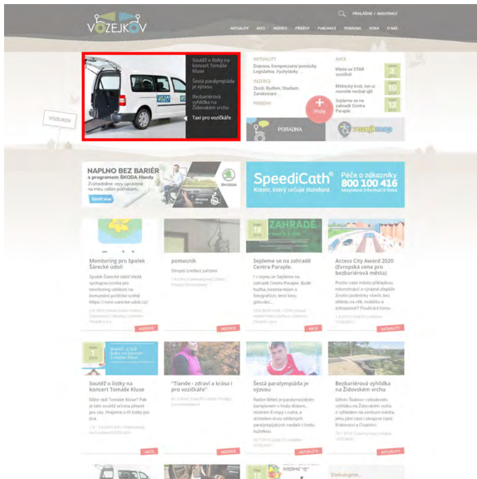
Homepage - Slider s článkem